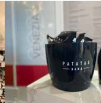
Mostra del Cinema di Venezia