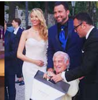
Matrimonio Sébastien Frey