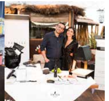
Evento Twiga Beach Club Versilia