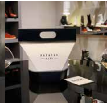
Milano Fashion Week