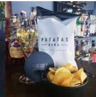
Ceresio 7 Milano