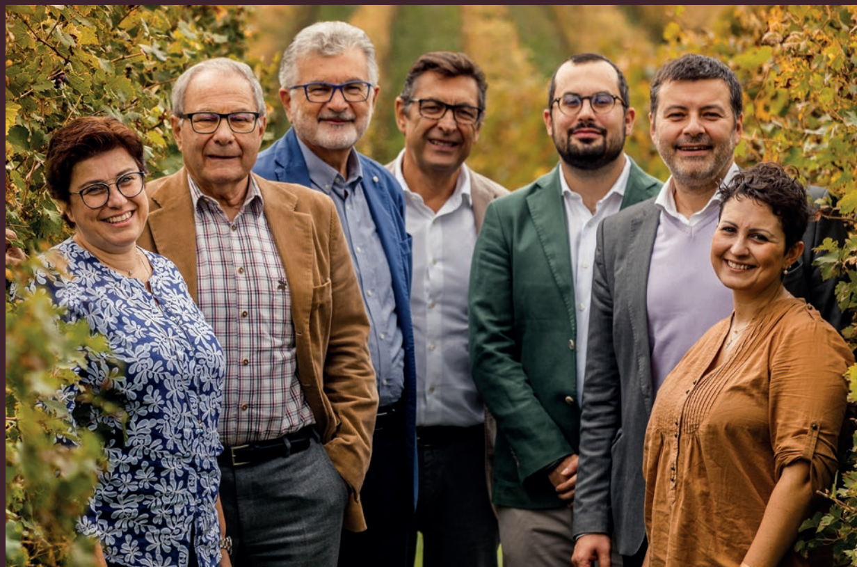
La Famiglia Boscaini

L'azienda è presente anche in Toscana e in Argentina , con le tenute a conduzione biologica Poderi BellOvile e Masi Tupungato .