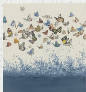
HE XI, 2019 何兮

Il progetto “Costasera Contemporary Art”, con cadenza biennale, prevede la selezione di un artista di fama internazionale, originario di una nazione legata a Masi e ai suoi vini, per realizzare un’opera dedicata all’Amarone Costasera e alla sua caratteristica etichetta. Una tiratura limitata di etichette numerate, con la riproduzione dell’opera d’arte, veste le bottiglie di un’annata speciale di Costasera.