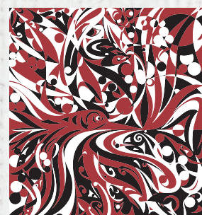
SUSAN A. POINT, 2017 Susan A. Point