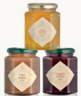
MIELE E CONFETTURE MIELE D'ACACIA, CONFETTURA EXTRA DI GELIFÈ, CREMA DI MARRONI